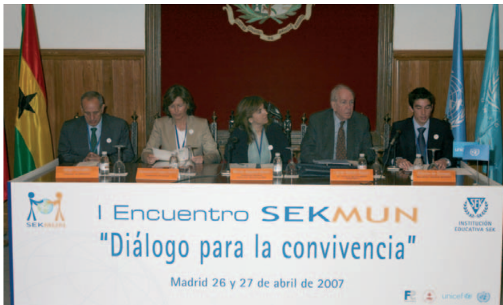
I Encuentro SEKMUN. Discurso de Inauguración a cargo de D. Carlos Robles Piquer.